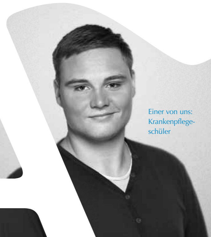
Einer von uns: Krankenpflege- schüler